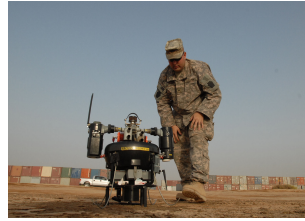
FIGURE 1.2 – Exemple d'image au format JPG.